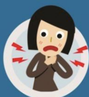
Inflamação da garganta