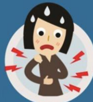
Dores no corpo