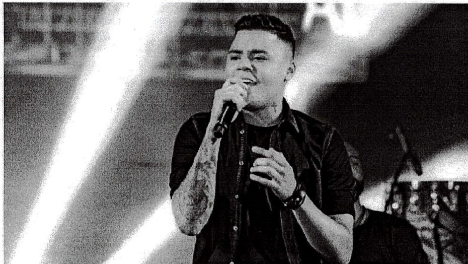
Felipe Araújo será atração no Passo a Paço 2022, em Manaus.

A Fundação Municipal de Cultura, Turismo e Eventos (Manauscult) divulgou a informação nesta quinta-feira (14/7). O cantor se apresentará no palco Tucupi, montado às margens do Rio Negro.