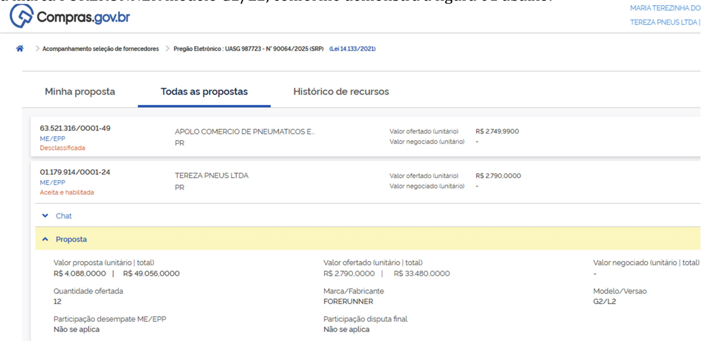
Figura 01 Propostas cadastradas item 24 PREGÃO ELETRÔNICO N. 064/2025

A empresa TEREZA PNEUS LTDA inscrita no CNPJ 01.179.914/0001-24, foi vencedora do item 24 com a marca FORERUNNER modelo G2/L2, conforme demonstra a figura 01 abaixo: